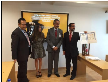
Los titulares de las sesiones son personalidades del sector y la industria.