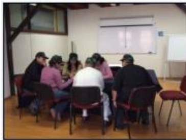
Más de 2,000 alumnos graduados desde 2006 en diversos programas.