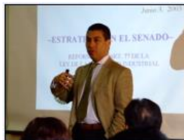
Posibilidad de conocer perspectivas diferentes sobre la industria.